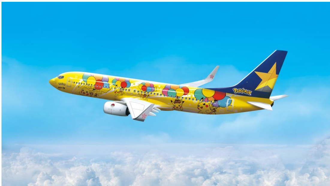
「ピカチュウジェット BC」 B737-800 JA73AB 号機