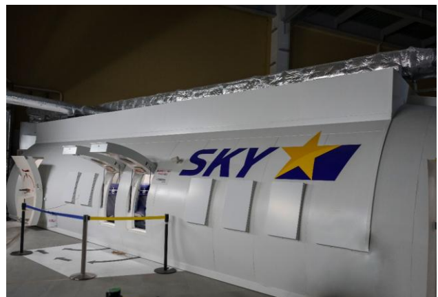
客室のモックアップ