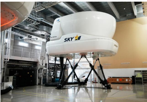
フルフライトシミュレーター

本キャンペーンは、マイページサービスにすでにご登録済みのお客様だけでなく、これからご登録されるお客様も応募できるキャンペーンとなっております。